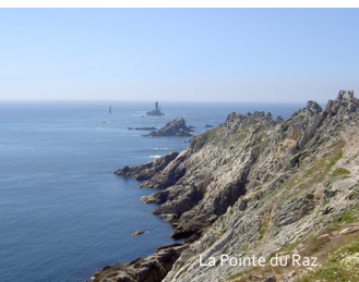
La Pointe du Raz