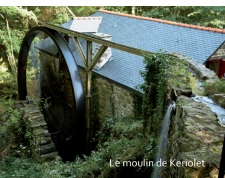
Le moulin de Keriulet